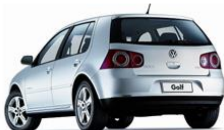
Ilustración 6 - Golf 1.6 Advance

Como ejemplo de declaración comprometida definiremos a partir de información disponible en Internet la declaración de importación de un vehículo marca Volkswagen Modelo Golf, originario y procedente de México. 1er Paso Leer la información completa de forma tal de obtener información para la clasificación Arancelaria a nivel S.I.M.