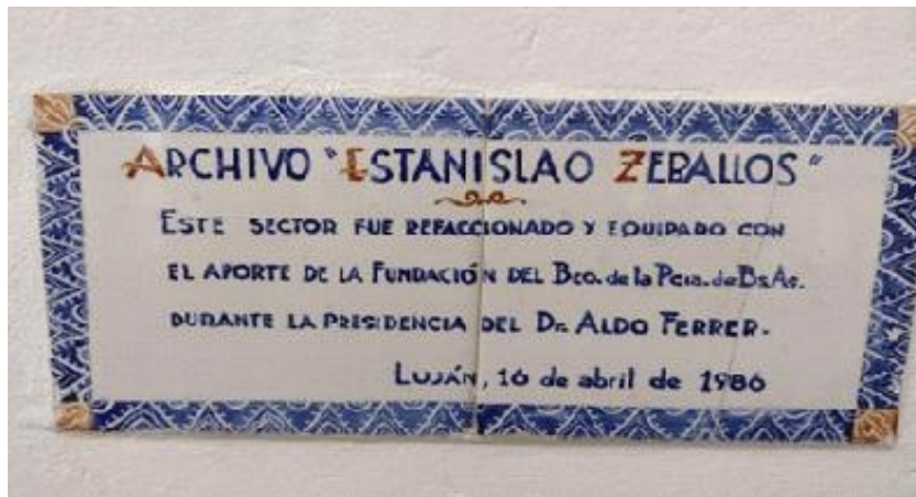
Foto 2. Placa en conmemoración de la inauguración de la nueva sede del Archivo