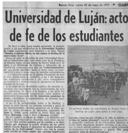
Figura 2. Cobertura del periódico Clarín sobre la peregrinación a Luján