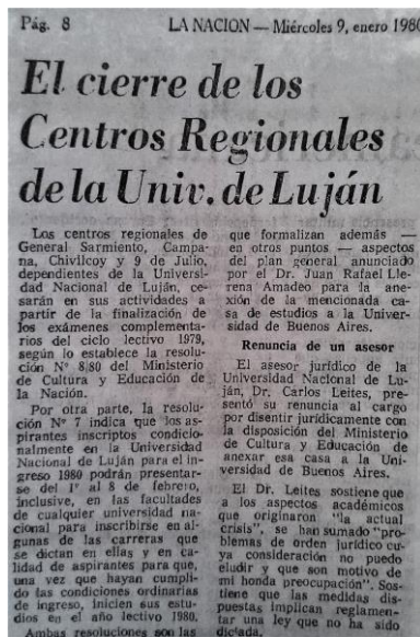
Figura 3. Artículo publicado en La Nación en el que entre otras noticias referidas a la UNLu se anunciaba el cierre de sus Centros Regionales